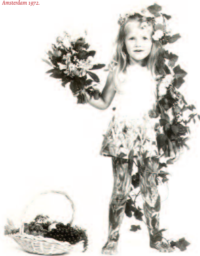
Florientje, het symbool van de Floriade Amsterdam 1972.

Archieven van de Floriade Rotterdam 1960, (1934) 1957-1965 (1967), omvang 1,75 m, de Floriade Amsterdam 1972, 1967-1974, omvang 1,95 m en de Floriade Amsterdam 1982, 1976-1984, omvang 2,50 m