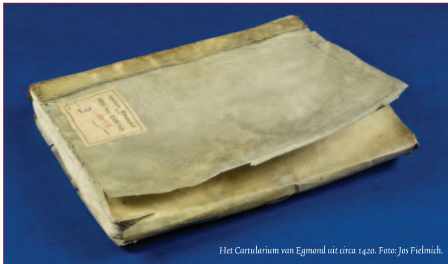
Het Cartularium van Egmond uit circa 1420.

Het eerste gebruik van de archieven was natuurlijk dat door de archiefvormers zelf bij het bestuur en beheer. Maar al tijdens de vorming begon het secundaire gebruik, het gebruik voor andere dan de administratieve