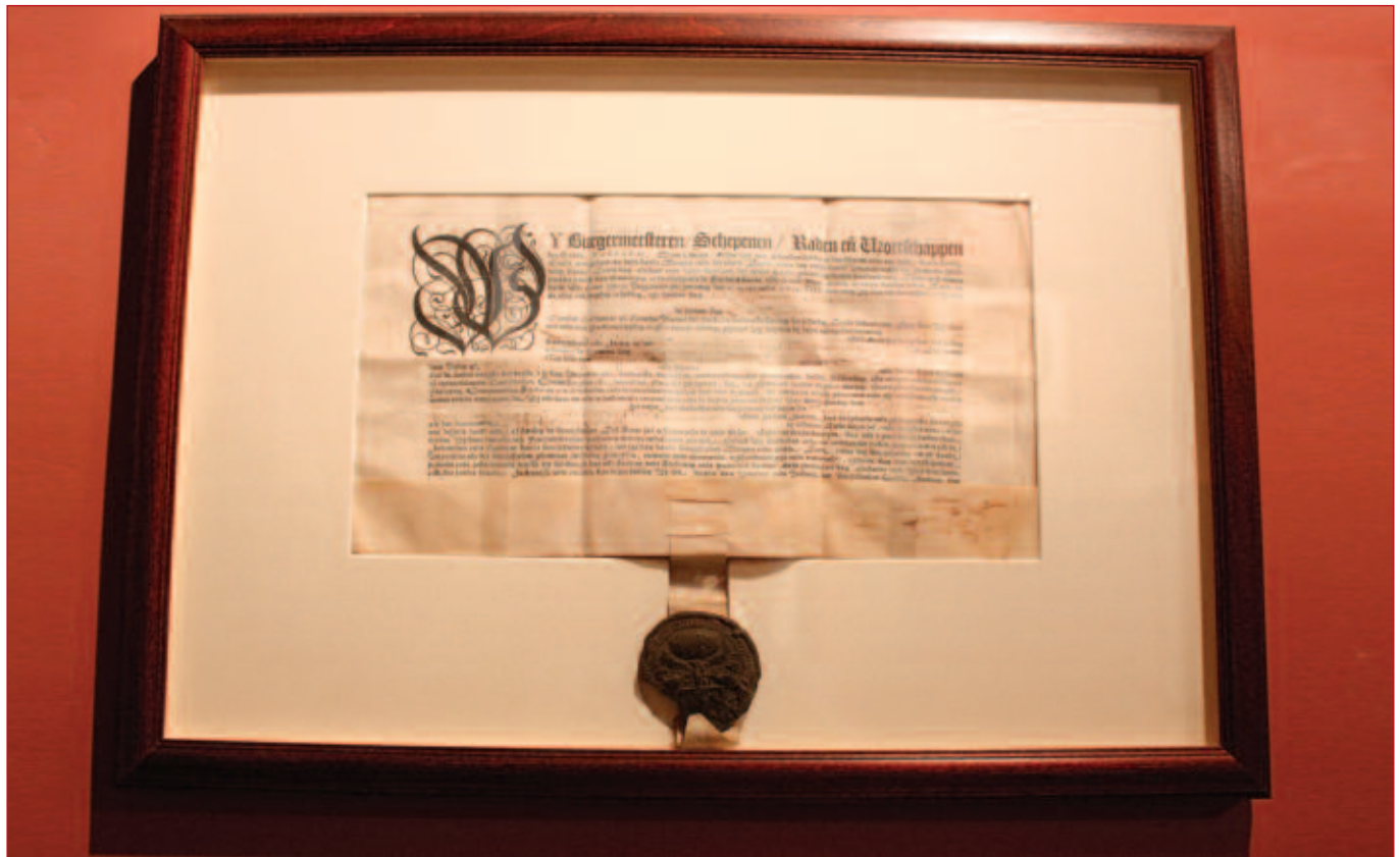
De ingelijste lijfrente.

Voor een nadere kennismaking met Palazzo Falson zie www.palazzofalson.com .