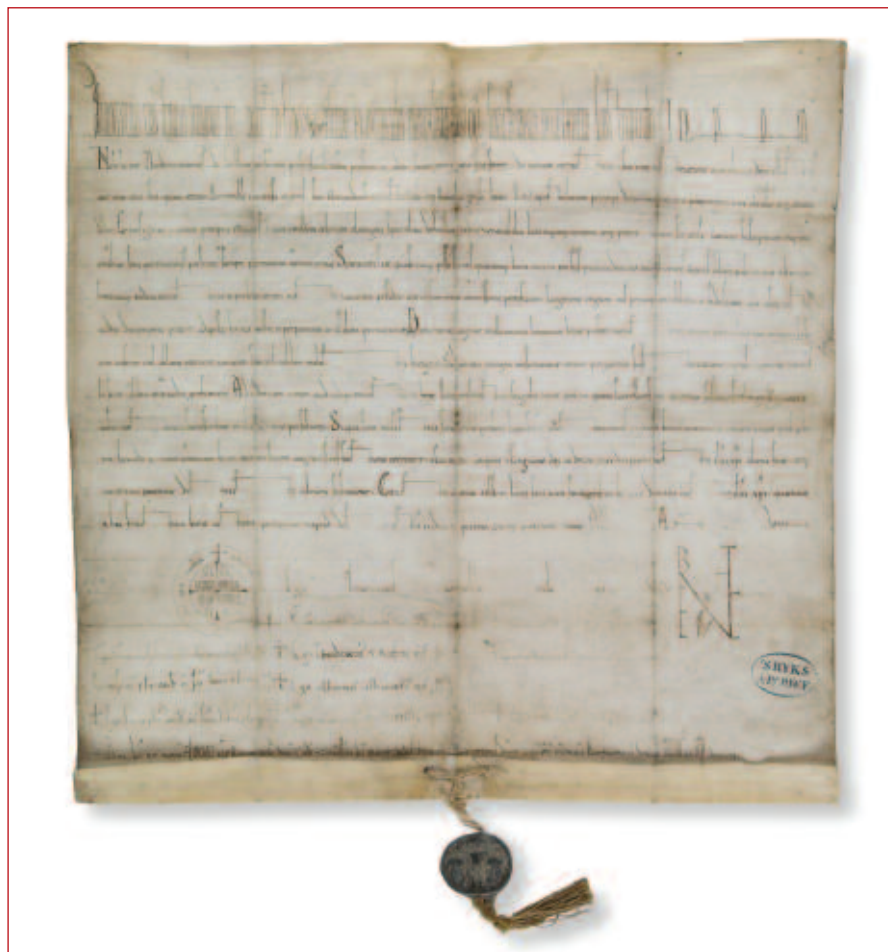
Het oudste archiefstuk van het Noord-Hollands Archief: een charter uit 1140 afkomstig van de abdij van Egmond.

Zoals gezegd dateert het oudste originele stuk uit 1140. Oudere stukken komen alleen voor in de vorm van later gemaakte afschriften. Zo is er een afschrift van een stuk uit 889,