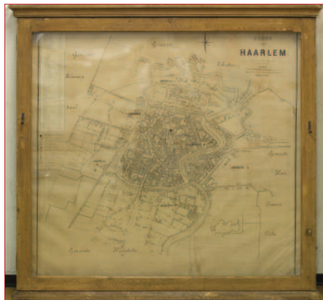
De Brandweerkart na de restauratie.

De kaart werd voorzichtig losgehaald, ontdaan van vuil, gespoeld, ontzuurd, gerepareerd, nagelijmd en gedoubleerd (aan de achterzijde werd een extra papieren laag aangebracht). Aan de randen van de kaart werden stroken Japans papier gezet zodat de kaart op een zuurvrije kartonnen drager en om een dikke plaat kapaline (lichtgewicht schuimplaat) heen gespannen kon worden. Alle hoedenspelden, naalden en spijkers werden ontdaan van oxidatie van het ijzer, koper of zilver door ze licht te schuren en te lakken. Met behulp van de foto's werden deze teruggeplaatst. Voor de nieuwe draden werd een neutrale